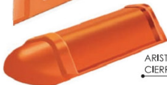
ARISTERO DE CIERRE

Son piezas destinadas a proveer el cierre lateral de la falda en reemplazo de otros elementos de madera, metal o mortero, con el consiguiente ahorro de mano de obra y materiales. Existen piezas izquierdas y derechas. Las izquierdas, de diseño similar al ilustrado, se colocan por debajo de las primeras tejas, en tanto que las derechas carecen de saliente en su extremo y se montan sobre los encastres de las últimas tejas. El sistema de fijación puede ser por clavado, pegado u otro, según las características del sustrato, requiriéndose 2,5 unidades por metro lineal.