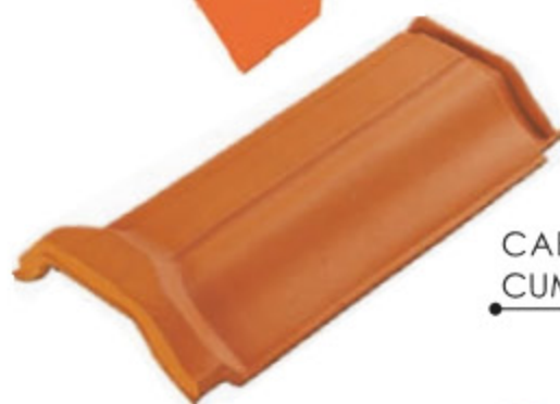
CABALLETE DE CUMBRE

Tiene por objeto materializar la unión de las cenefas izquierdas y derechas sobre el tapacán. Esta pieza es fijada por clavado y constituye el cierre adecuado entre el extremo del caballete y las cenefas entre sí.