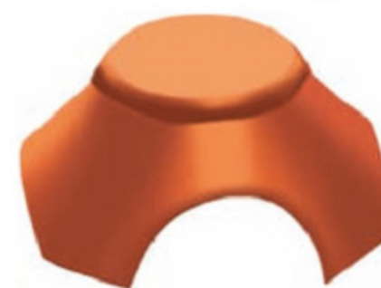
ENCUENTRO EN 3 Ó 4 DIRECCIONES

Se utiliza para cubrir las uniones de faldones en limatesas. Su ancho más reducido que el accesorio cumbre resulta en una junta diferente a aquella quedando claramente definida la función estructural de cada elemento. Puede ser usado también como cumbre. Se requieren 2,5 unidades por metro lineal.